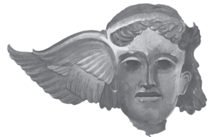
Hypnos: der Gott des Schlafes